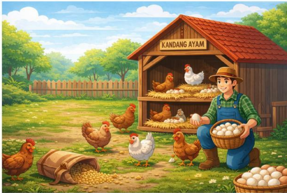
Gambar 1 Ilustrasi kegiatan peternak ayam

Seorang peternak telur ayam mencatat jumlah telur yang berhasil dikumpulkan selama 20 hari dari kandangnya yang dihasilkan oleh puluhan ayam yang dipeliharanya. Telur yang dihasilkan tiap harinya sebagai berikut: