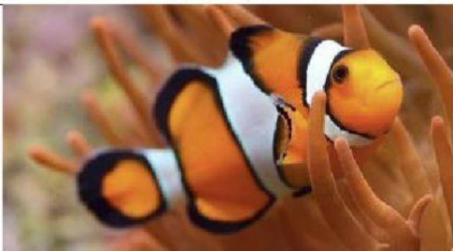
Le poisson clown