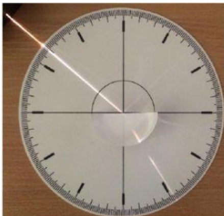
Bandymas Nr. 3