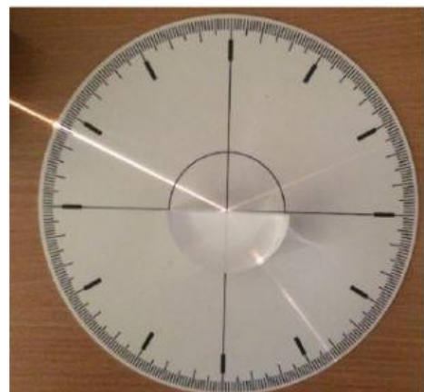
Bandymas Nr. 4