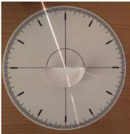
Bandymas Nr. 1