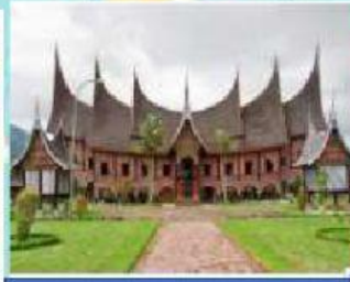
Rumah adat Sumatra Barat