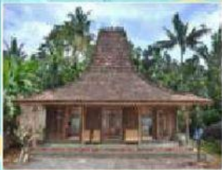
Rumah adat Jawa Tengah