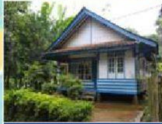
Rumah adat Jawa Barat