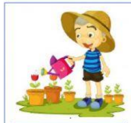
REGANDO LAS PLANTAS