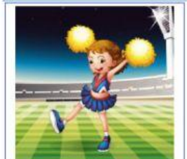
BAILANDO EN EL ESTADIO