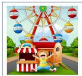
SALTANDO EN EL PAQUE DE ATRACCIONES