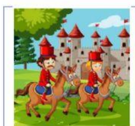
LLENDO AL CASTILLO

1. Match the card with the correct image.