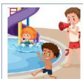
CORRIENDO EN EL PARQUE ACUÁTICO