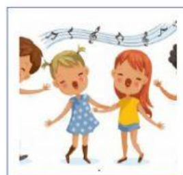
CANTANDO UNA CANCIÓN