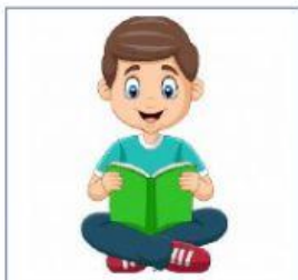
LEYENDO UN LIBRO