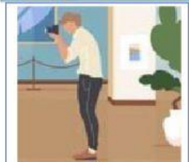
ECHANDO FOTOS DE LA GALERÍA DE ARTE