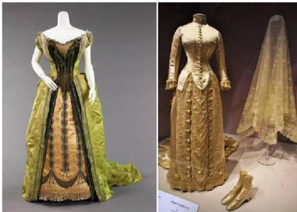
À gauche : Charles Frederick Worth, Robe de soirée, vers 1887, The Metropolitan Museum of Art, New York. À droite : Charles Frederick Worth, Robe de mariage et accessoires, 1879

Mais pour attirer la riche clientèle parisienne , Charles fait aussi un génie du "marketing", l'art de commercialiser un produit ou un service... et de donner envie de l'acheter !