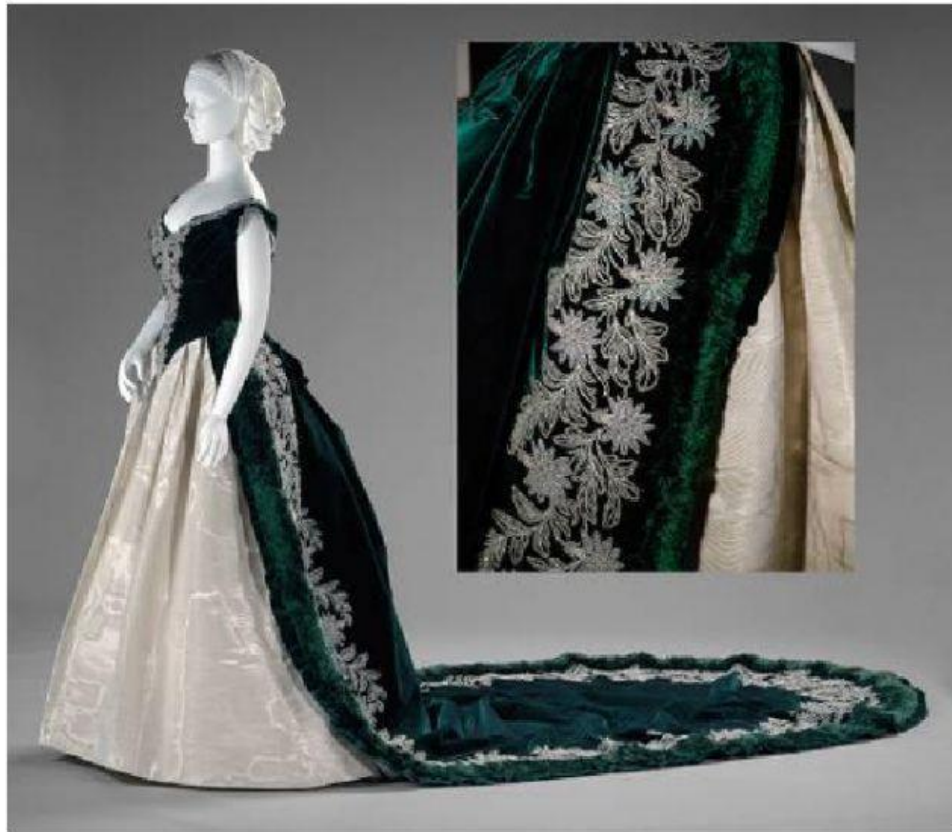
Charles Frederick Worth, Robe de cour impériale russe , vers 1888, Indianapolis Museum of Art, Newfields Voir en grand

Mais pour attirer la riche clientèle parisienne , Charles fait aussi un génie du "marketing", l'art de commercialiser un produit ou un service... et de donner envie de l'acheter !