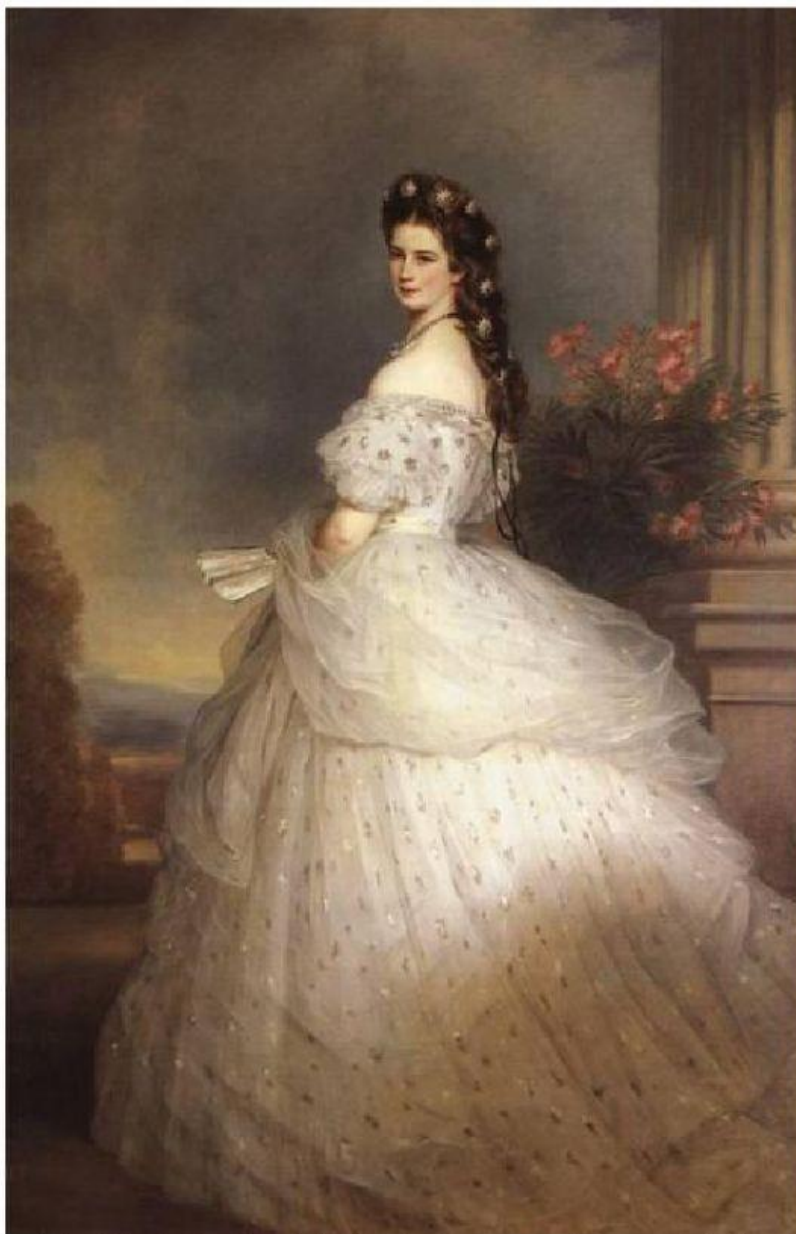
Franz Xaver Winterhalter, L'impératrice Élisabeth de Wittelsbach (connue sous le surnom de Sissi), portant une robe du créateur Worth, 1865, huile sur toile, Kunsthistorisches Museum, Vienne

Comme ça, la haute couture devient symbole international du bon goût et du savoir-faire français... grâce à un Anglais !