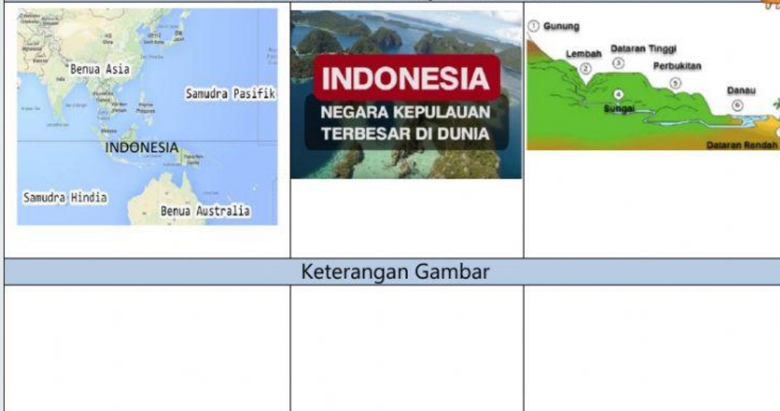
Gambar Kondisi Wilayah Indonesia

Tariklah kotak keterangan di bawah ini ke bawah gambar yang sesuai!