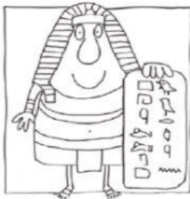
El antiguo Egipto

Marca el tema que te produce más curiosidad y explica abajo por qué.