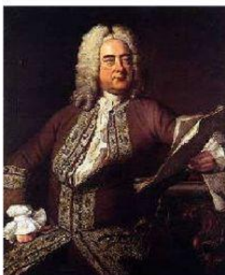
G. Friedrich Händel