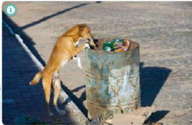
CACHORRO PROCURANDO COMIDA EM TAMBOR DE LIXO, EM MARAÚ (BAHIA), 2014.

VOCÊ TEM ALGUM ANIMAL DE ESTIMAÇÃO OU CONHECE ALGUÉM QUE TENHA? QUE CUIDADOS ESSE ANIMAL RECEBE? VEJA OS ANIMAIS DAS FOTOGRAFIAS ABAIXO: