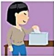
MESA DE VOTACIÓN