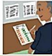
CÉDULA DE VOTACIÓN