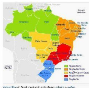
Mapa político do Brasil, mostrando o estado por estados e regiões