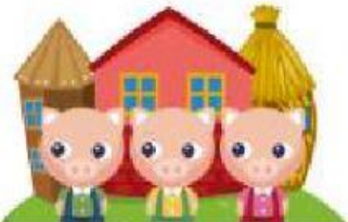
Los tres cerditos