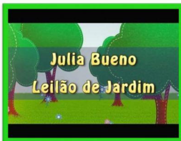
Figura 1 https://www.youtube.com/watch?v=x1laU-5f7rQ