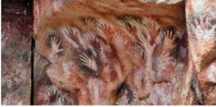
"Cueva de las manos", Argentina

Adoraban una entidad femenina que representaba la fertilidad, la vida y les brindaba protección.