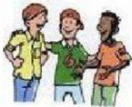
quedar con los amigos