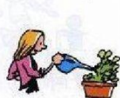
cuidar las plantas