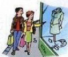
ir de compras