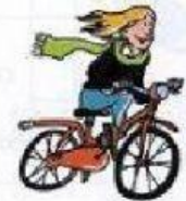
montar en bicicleta