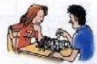
jugar al ajedrez