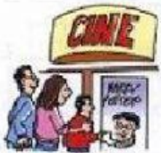
ir al cine

Marca las actividades que más te gustan realizar.