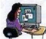
navegar por Internet