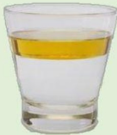
agua y aceite