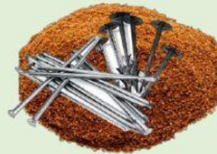
tierra y clavos