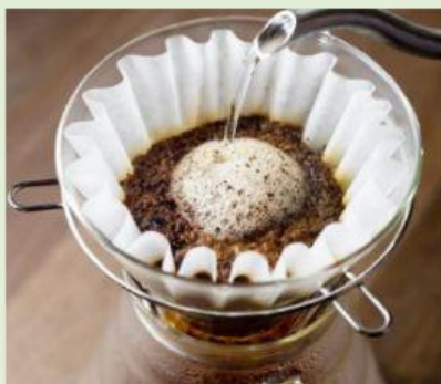
café y agua