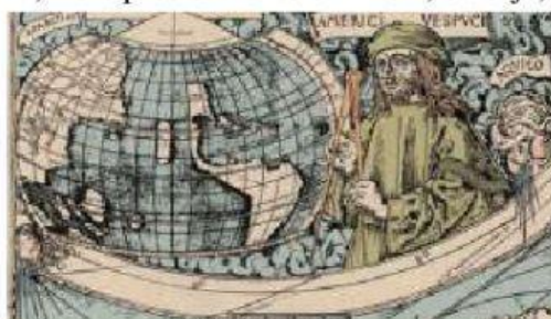
Imagem disponível em: https://www.bbc.com/portuguese/vert-tra-45596137 Acesso em: 22 de fev. de 2021.

3-O pioneirismo português foi resultado de uma série de condições que permitiram a esse pequeno país da Península Ibérica lançar-se nessa empreitada. Dos três fatores abaixo quais destacam o pioneirismo de Portugal? Arraste as duas opções nos espaços em azul.