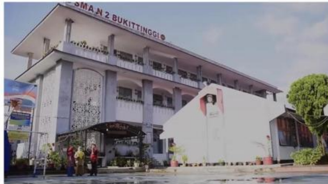
Gambar 1. SMA Negeri 2 Bukittinggi

Perhatikan gambar dan bacalah wacana berikut!