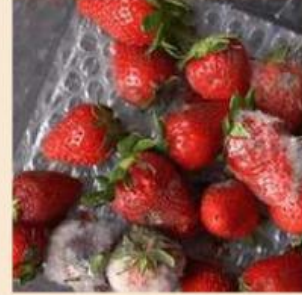
Gambar 22. Strawberry Mengalami Pembusukan (Vadim, 2025)