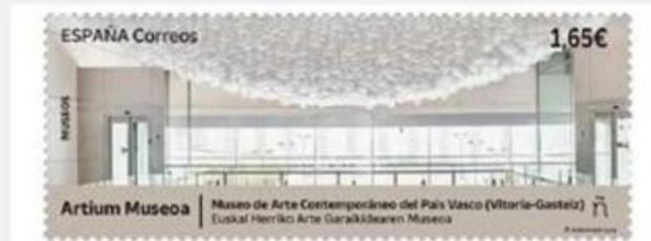
Sello dedicado al Artium Museoa

6 "Venecia es una ciudad llena de brillos y reflejos; una ciudad doble: la construida en el aire y la construida en el agua, siempre cambiante. Me fijé en el elemento arquitectónico de las cúpulas como representación de lo celeste. Al invertir la cúpula, como si estuviera reflejada en el agua, también se invierte la sensación espacial, que se convierte en un espacio opresivo, un cielo sólido que amenaza con derrumbarse", explica Javier Pérez sobre su trabajo.