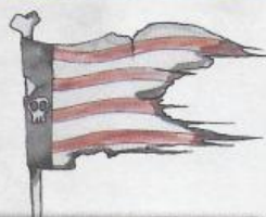
La Senyera calavera