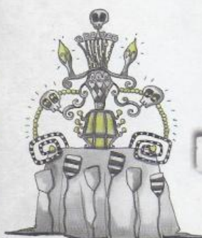
Gaiata de la Magdalena