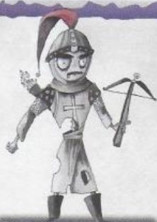
El Centenar de la Ploma