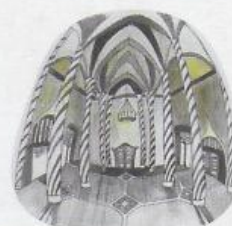
La Llotja de la Seda