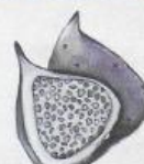
La figa ta tia