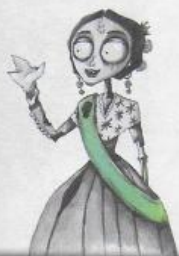
Reina de les Festes de Castelló

Junt amb Avinyó i, per descomptat, Roma, Peníscola és la tercera seu pontificia que ha existit. Així va ser durant l'última etapa del Cisma d'Occident, un període dels segles XIV i XV en què van conviure dos papes, cadascun amb els seus partidaris i detractors. En l'activitat que et proposem també trobaràs personatges i coses que formen parelles inseparables, però que per alguna raó ara apareixen separats. Podràs unir-los de nou?