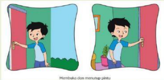
Membuka dan menutup pintu

Anak-anak setelah kita mencermati video tema 8 sub 3 pb 1 dan 2, coba sekarang tentukan hubungan gaya dengan gerak pada peristiwa-peristiwa di bawah ini !