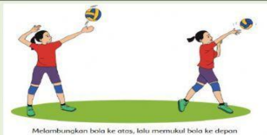
Melambungkan bola ke atas, lalu memukul bola ke depan

Gaya mempengaruhi benda diam menjadi bergerak