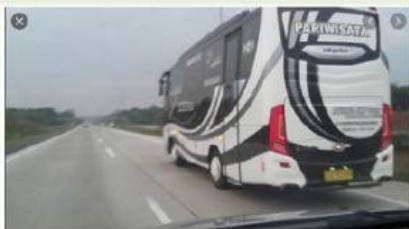
Bus Melaju dengan Lebih Cepat

Gaya mempengaruhi benda bergerak menjadi diam