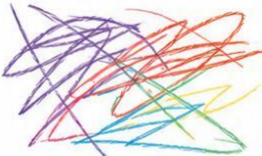
Imagen 1: Rayas y trazos desordenados.

Instrucción: Observa la imagen y escribe la letra de la etapa de Lowenfeld que corresponda.