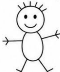
Imagen 2: Monigote o "renacuajo" simple.