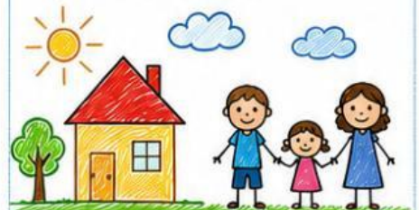
Imagen 3: Dibujo con suelo, casa y personas reales.