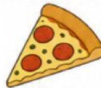
Rebanada de pizza