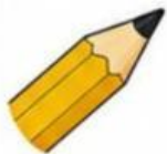
Punta de lápiz