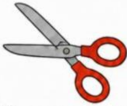
Tijeras poco abiertas

2. Observe con atención las siguientes figuras e indique sus ángulos según su amplitud.