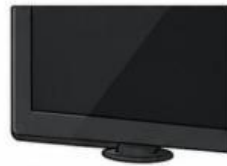
Esquina de una televisión