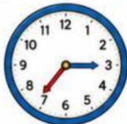
Reloj con manecillas