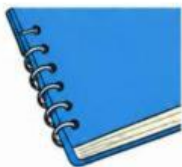
Esquina de cuaderno