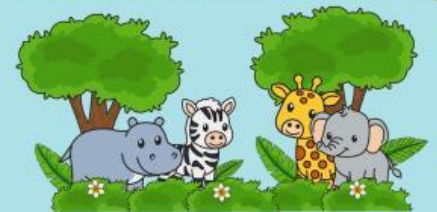
Tempat tinggal makhluk hidup