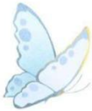
Kupu - kupu

Lingkari nama binatang mana saja yang bisa terbang!