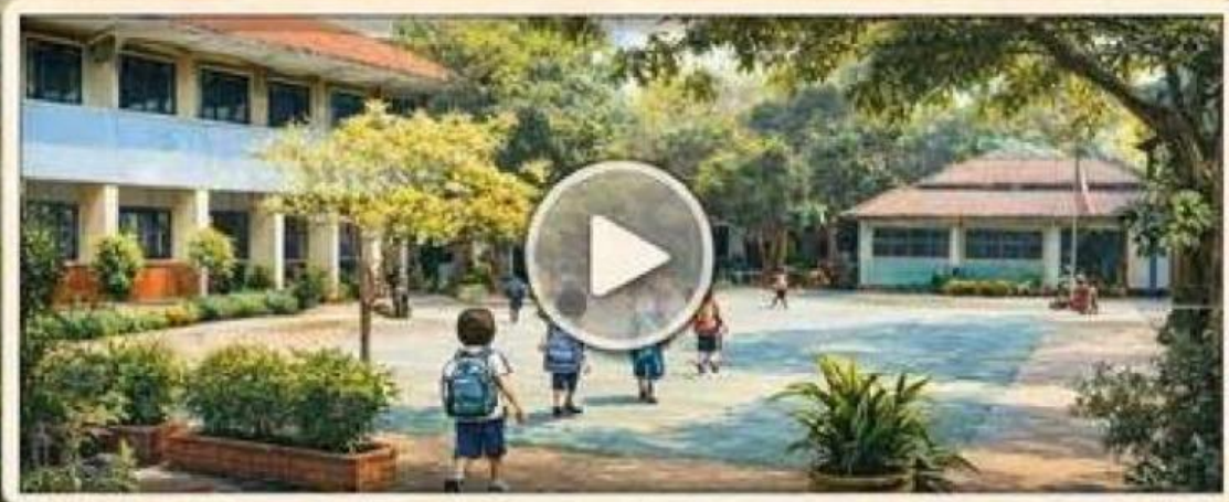
Video direkam langsung di lingkungan sekolah.