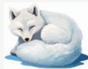
raposa do ártico