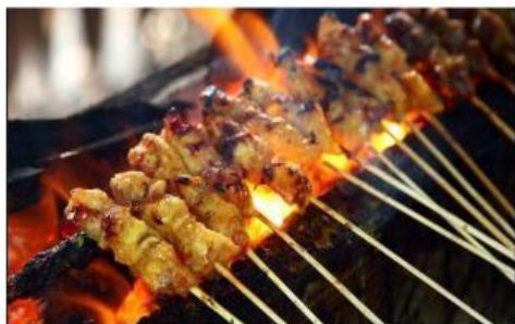
Gambar 8. Pembakaran sate

Dalam kehidupan sehari-hari, proses memasak makanan dapat dilakukan dengan berbagai cara dan bentuk penyajian yang berbeda. Ada makanan yang dipotong menjadi bagian-bagian kecil sebelum dimasak seperti sate dan ada pula yang dimasak dalam potongan besar seperti steak.