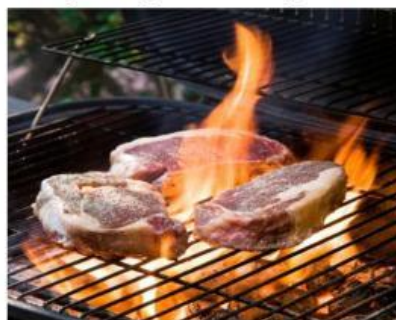
Gambar 9. Pembakaran steak

Perbedaan proses pemasakan tersebut menunjukkan bahwa suatu reaksi dapat berlangsung dengan kecepatan yang berbeda-beda. Pada proses pembakaran makanan, terdapat faktor tertentu yang dapat memengaruhi cepat atau lambatnya reaksi berlangsung sehingga makanan dapat matang dalam waktu yang tidak sama.