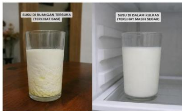
Gambar 7. Kondisi susu di ruangan terbuka dan di dalam kulkas

Setiap bahan makanan memiliki daya tahan yang berbeda terhadap kondisi lingkungan di sekitarnya. Pada gambar 7 terlihat susu yang disimpan di ruangan terbuka mengalami perubahan kondisi lebih cepat dibandingkan susu yang disimpan di dalam kulkas.