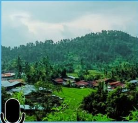
Terangun, Gayo Lues