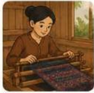
Waktu membuat 1 helai kain tenun

Seorang perajin lokal menyatakan bahwa waktu untuk membuat 1 helai kain tenun sama dengan waktu untuk membuat 2 helai kain batik tulis ditambah 5 hari.