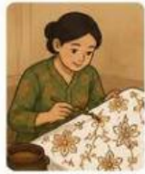
Waktu membuat 2 helai kain batik tulis