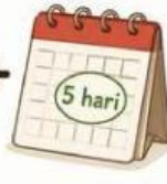
ditambah 5 hari

Tuliskan bentuk persamaan linear dari pernyataan perajin tersebut. Apakah persamaan ini dapat langsung diselesaikan untuk mencari waktu pembuatan masing-masing kain?