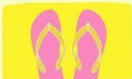
las chancletas / chanclas