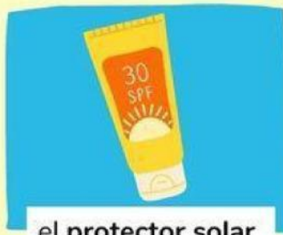
el protector solar