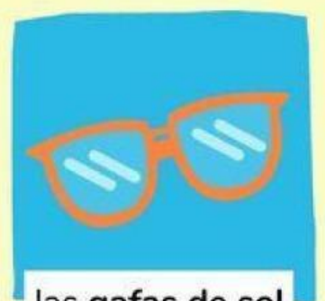
las gafas de sol