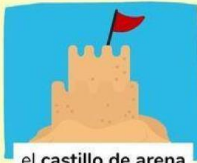
el castillo de arena