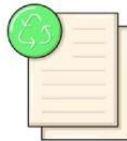
Kertas daur ulang