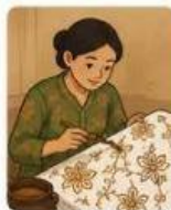
Waktu membuat 2 helai kain batik tulis