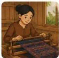
Waktu membuat 1 helai kain tenun

Seorang perajin lokal menyatakan bahwa waktu untuk membuat 1 helai kain tenun sama dengan waktu untuk membuat 2 helai kain batik tulis ditambah 5 hari.