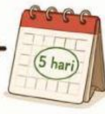
ditambah 5 hari

Tuliskan bentuk persamaan linear dari pernyataan perajin tersebut. Apakah persamaan ini dapat langsung diselesaikan untuk mencari waktu pembuatan masing-masing kain?