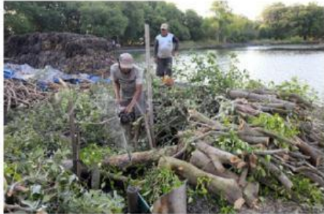
Rusaknya hutan bakau