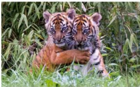
Populasi hewan dan tumbuhan terancam