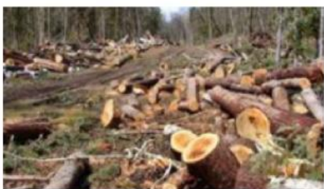
Banyaknya hutan gundul