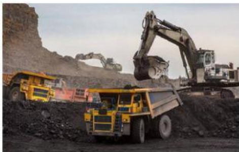
Lingkungan rusak akibat pertambangan