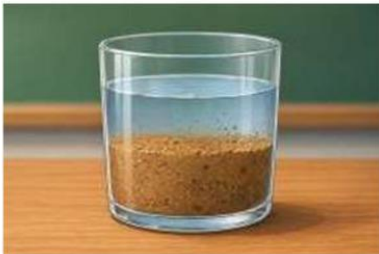
Gambar 3.4. Air dan pasir

Campuran yang tidak tercampur sempurna dan masih dapat dibedakan.