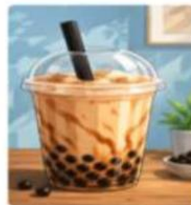
Gambar 3.2. Minuman boba

Contoh lain adalah minuman boba yang terdiri atas campuran susu, gula, es, dan bola tapioka. Banyak siswa menyukai minuman ini karena rasanya manis dan menarik. Namun, konsumsi minuman manis secara berlebihan dapat berdampak buruk bagi kesehatan tubuh.