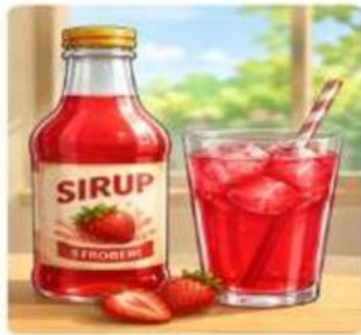
Gambar 3.1. Sirup

Setiap hari, kamu sering membeli minuman seperti es teh, susu cokelat, sirup, boba, atau minuman bersoda. Selain itu, kamu juga mengonsumsi makanan seperti bakso, sup, salad buah, dan mi instan. Tahukah kamu bahwa sebagian besar makanan dan minuman tersebut merupakan campuran?