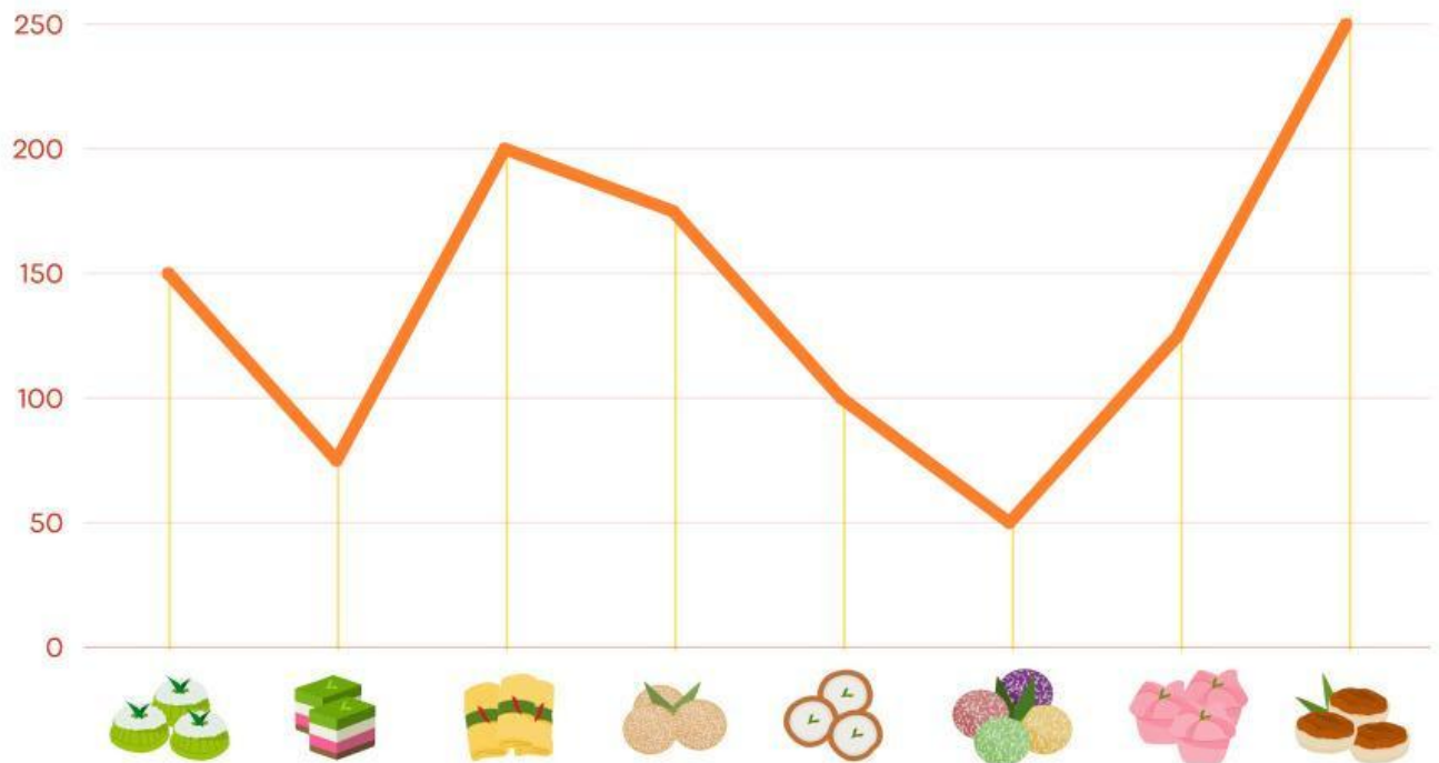
Survei Makanan Tradisional

Perhatikan diagram garis di bawah ini kemudian tentukan jumlah hewan dengan tepat!