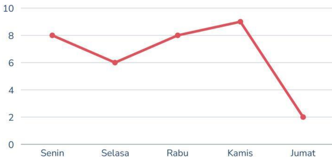
Data penjualan buku tulis di koperasi sekolah

Perhatikan diagram garis berikut ini kemudian tentukan pernyataan di bawah merupakan pernyataan yang benar atau salah!