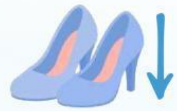
Gambar sepatu hak tinggi

Taukah kamu, dalam dunia fashion konsep tekanan dapat diamati pada penggunaan sepatu hak tinggi sebagai bagian dari gaya dan penampilan. Sepatu hak tinggi memiliki luas bidang tekan yang jauh lebih kecil dibandingkan sepatu biasa. Akibatnya, tekanan yang dihasilkan menjadi lebih besar meskipun gaya yang diberikan sama. Hal ini menyebabkan sepatu hak tinggi lebih mudah menekan permukaan lunak seperti tanah atau pasir. Konsep ini menunjukkan bahwa tekanan berbanding terbalik dengan luas permukaan, sehingga semakin kecil luas permukaan, semakin besar tekanan yang dihasilkan.