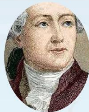
Blaise Pascal, (1623-1662)