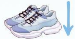
Gambar sepatu biasa

Tekanan ini didefinisikan sebagai gaya persatuan luas. Jika gaya sebesar F bekerja secara merata dan tegak lurus pada suatu permukaan yang luasnya A , maka tekanan P pada permukaan itu: