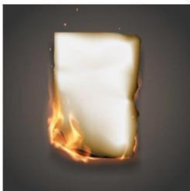
Gambar 3. Kertas dibakar

Setiap reaksi membutuhkan waktu yang berbeda untuk menghasilkan perubahan. Perbedaan waktu tersebut menunjukkan perbedaan laju reaksi.