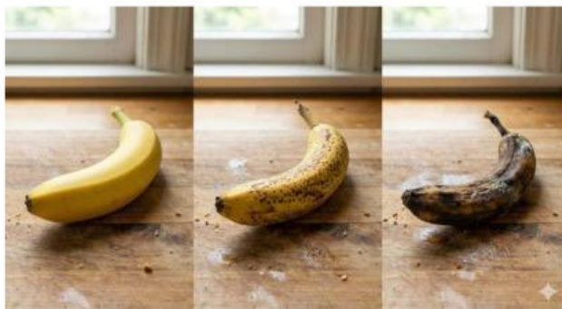
Gambar 4. Pembusukan buah pisang