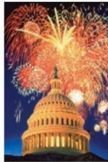
Gambar 1. Kembang Api

Saat dinyalakan kembang api menyala sangat cepat dan menghasilkan cahaya serta warna-warna yang indah dalam waktu singkat. Peristiwa ini terjadi hampir seketika setelah sumbu dibakar, tanpa membutuhkan waktu lama untuk menunggu hasil reaksinya.