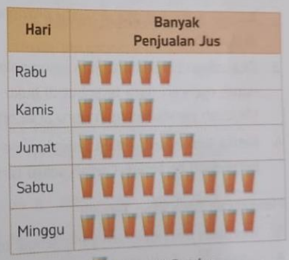
Keterangan: mewakili 5 gelas.