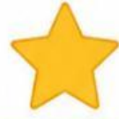
HÌNH NGÔI SAO