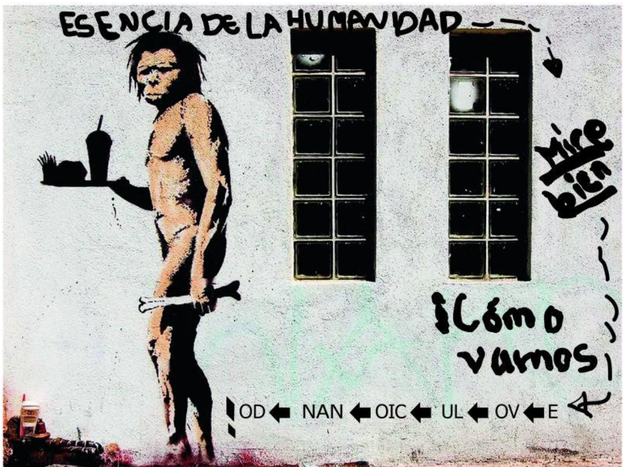
Grafiti anónimo escrito en la Universidad Nacional.