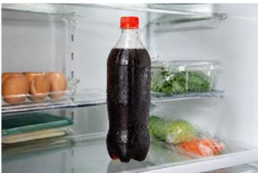
Gambar 2. Minuman bersoda

Pernahkah kamu menyimpan minuman bersoda di kulkas selama beberapa hari tanpa membukanya sama sekali? Menariknya, meskipun sudah disimpan cukup lama, saat botol dibuka minuman tersebut tetap terasa segar, asam, dan masih bergelembung seperti baru pertama kali dibeli.