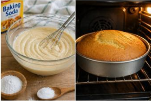
Gambar 1. Pembuatan kue

Pernahkah kamu memperhatikan proses pembuatan kue yang dipanggang di dalam oven?