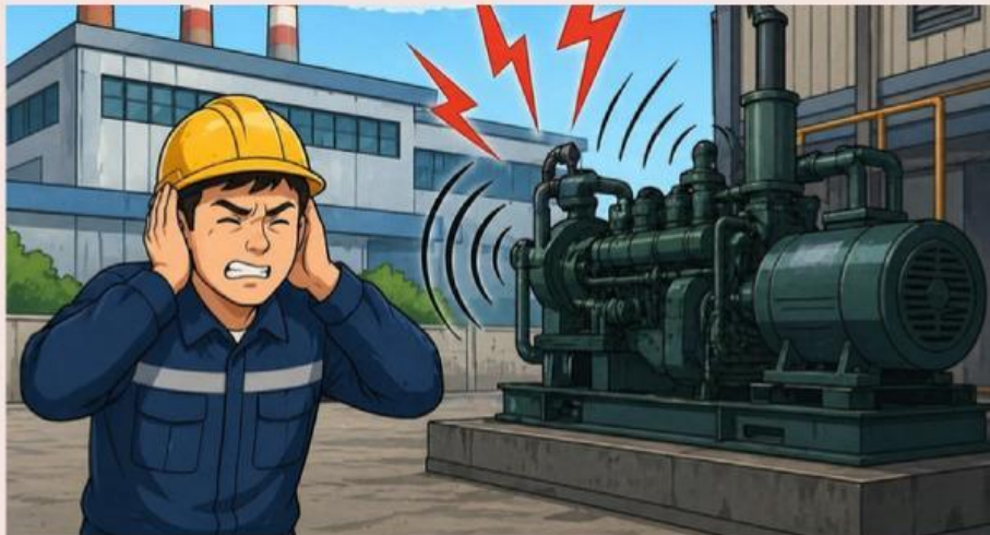
Gambar 1.3 Pencemaran Suara oleh mesin pabrik.

Pencemaran Suara: Suara yang mengganggu kenyamanan dan kesehatan manusia serta hewan, misalnya bunyi kendaraan, sirine, tembakan, dan mesin pabrik.