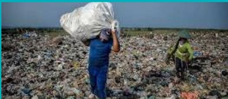
Gambar 1.2 Pencemaran Tanah oleh Limbah Plastik

Pencemaran Tanah: Masuknya zat atau senyawa berbahaya ke dalam tanah yang menurunkan kesuburan tanah dan produktivitas lahan. Contohnya limbah kimia dan plastik.