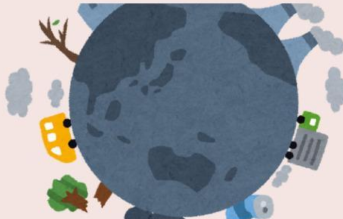
Gambar 1.4 Pencemaran Udara oleh Asap kendaraan dan asap pabrik.

Pencemaran Udara: Tercampurnya udara normal dengan polutan atau senyawa berbahaya sehingga kualitas udara menurun. Contohnya asap kendaraan, asap pabrik, dan pembakaran sampah