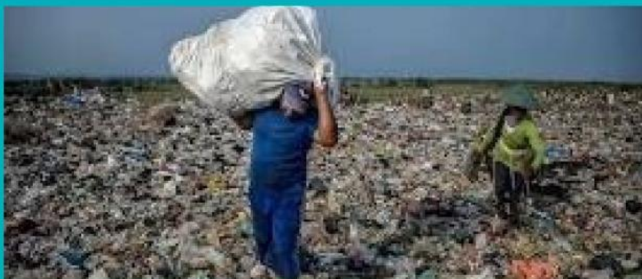
Gambar 1.2 Pencemaran Tanah oleh Limbah Plastik

Pencemaran Tanah: Masuknya zat atau senyawa berbahaya ke dalam tanah yang menurunkan kesuburan tanah dan produktivitas lahan. Contohnya limbah kimia dan plastik.