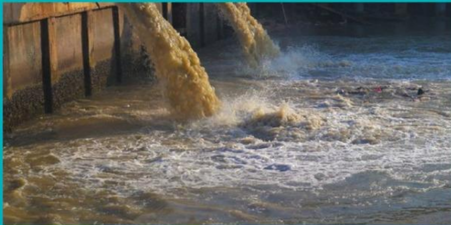
Gambar 1.1 Pencemaran Air oleh Limbah Industri

Pencemaran Air: Masuknya zat berbahaya ke perairan yang menurunkan kualitas air dan mengganggu ekosistem akuatik. Contohnya limbah industri, pestisida, dan sampah domestik.