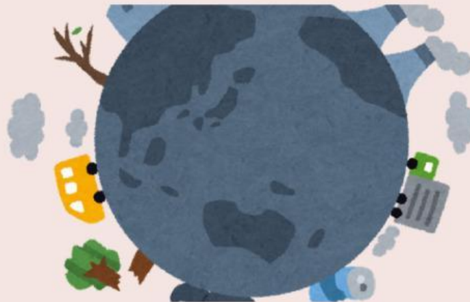
Gambar 1.4 Pencemaran Udara oleh Asap kendaraan dan asap pabrik.

Pencemaran Udara: Tercampurnya udara normal dengan polutan atau senyawa berbahaya sehingga kualitas udara menurun. Contohnya asap kendaraan, asap pabrik, dan pembakaran sampah