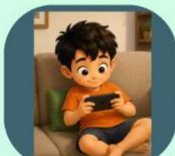
2. Bermain game di ponsel