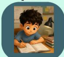
5. Belajar untuk ulangan minggu depan