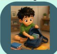
6. Membereskan tas sekolah yang berantakan

Identifikasilah setiap kegiatan tersebut ke dalam tabel berikut: