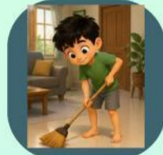
3. Membantu ibu menyapu rumah karena tamu akan datang sebentar lagi