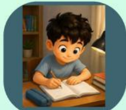
1. Mengerjakan PR yang harus dikumpulkan besok pagi

Budi memiliki beberapa kegiatan yang harus ia lakukan hari ini setelah pulang sekolah. Berikut kegiatannya: