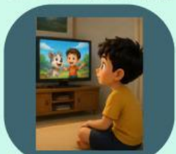
4. Menonton acara televisi favorit