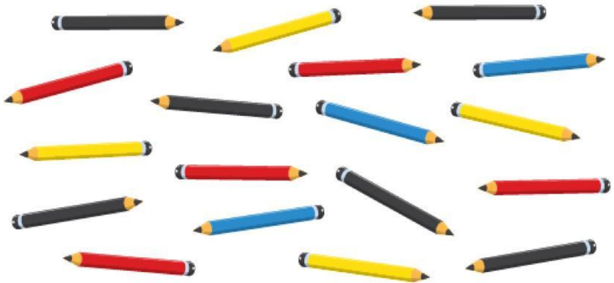
Tabel Pensil Warna

2. Isilah tabel dan jawab pertanyaannya.