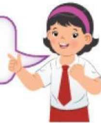
Tabel Pita Wei