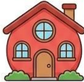
Nhà màu Đỏ: