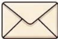
Phong bì thư