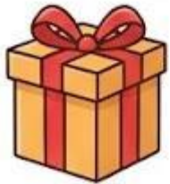
Hộp quà vuông