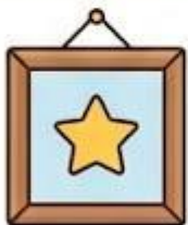
Khung ảnh vuông