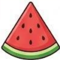
Miếng dưa hấu