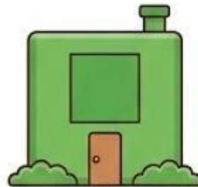
Nhà màu Xanh Lá: