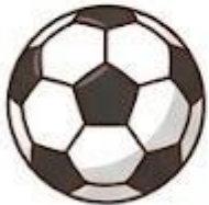
Quả bóng tròn