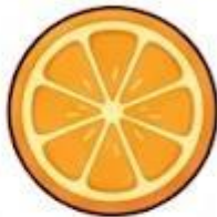
Lát cam tươi