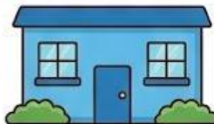
Nhà màu Xanh Dương: