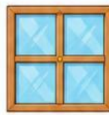
Ô cửa sổ